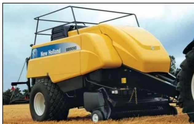
Billedet viser en New Holland Presser.

Tilslutninger: A = 1 3/8-6 B = 1 3/4-6 20 = 1 3/4-20 21 = 1 3/8-21